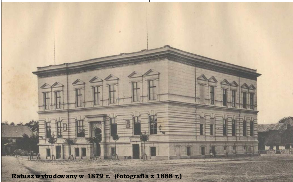
Ratusz wybudowany w 1879 r. (fotografia z 1888 r.)

Rynek nie był wybrukowany i dopie- ro zalecenia „pierwszego prezydenta królewskiego sądu apelacyjnego w Po- znaniu” nakazały najpierw wybrukować cały plac, a po negocjacjach tylko ścieżki dochodzące do sądu.