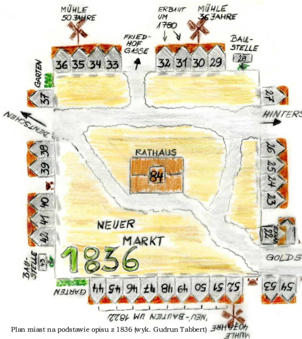
Plan miast na podstawie opisu z 1836 (wyk. Gudrun Tabbert)