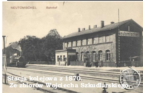
Stacja kolejowa z 1870. Ze zbiorów Wojciecha Szkuclarskiego.

miastem, ale Nowy Tomyśl był zamieszka- wany w zdecydowanej większości przez Niemców. Powiat dalej nazywał się bukowski, ale siedziba władz była już w Nowym Tomyślu.